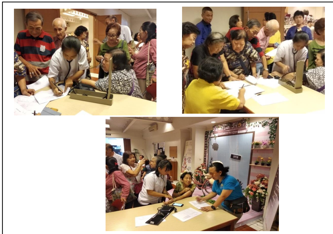
Gambar 2. Pemeriksaan Kesehatan Umum

Sesuai data yang diterima bahwa pada 23 pasien lansia yang terdiri dari 6 laki-laki dan 17 perempuan, rata-rata usia 70.9 tahun SD \pm 8.6 tahun. Hasil rata-rata tekanan darah sistole 117.39 dan diastole 77.39 serta nadi 77.57 yang menunjukkan atau masuk didalam kriteria normal. Berdasarkan data yang diperoleh, lansia yang hadir pada saat kegiatan PKM Prodi perempuan dengan kelompok umur 70-74 tahun berjumlah 2,21% dan lansia laki-laki berjumlah 1,87%. Kelompok lansia dengan usia 75+ yang berjenis kelamin perempuan 2,73% dan lansia laki-laki berjumlah 1,87%. Komposisi tahun 2018 lansia perempuan berjumlah 2.804.900 dan laki-laki berjumlah 2.012.300.