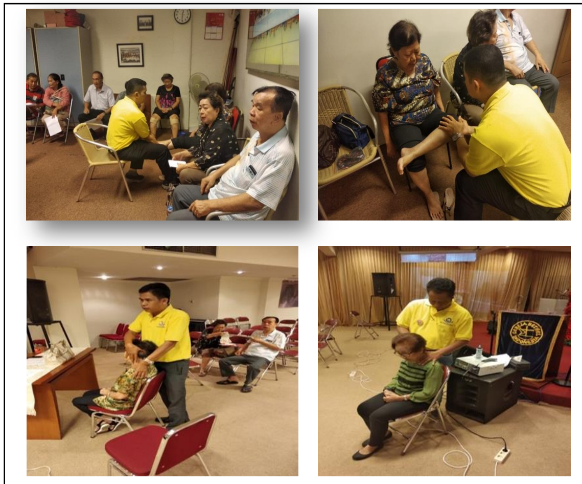
Gambar 1. Pemeriksaan dan Intervensi dari Tim Fisioterapis

dengan modalitas terapi sinar infra merah, terapi ultrasonik, terapi latihan, terapi manual, terapi pijat, terapi stimulasi elektrik dan latihan di rumah. Setiap terapis menerapi satu orang.