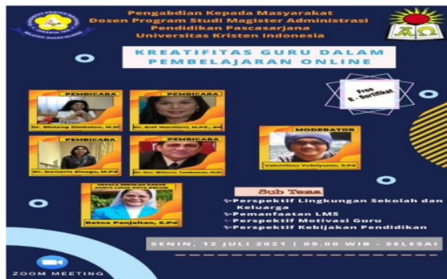
Gambar 2. Flyer Pelaksanaan Penyuluhan

Sesuai dengan perencanaan, penagajuan proposal dan proses melalui LPPM UKI, maka kegiatan penyuluhan dilaksanakan pada tanggal 12 Juli 2021. Kegiatan penyuluhan ini dilaksanakan secara dalam jaringan (online).