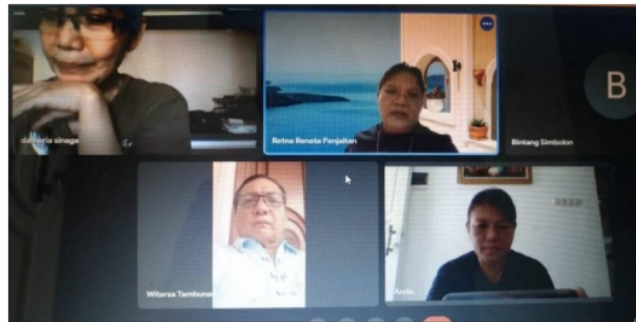
Gambar 1. Pelaksanaan Focus Group Discussion dengan Kepala SD Santa Lucia Bekasi

Dalam diskusi tersebut dibahas tentang bagaimana manajemen dan strategi yang ditentukan sekolah dalam menyikapi dan mendukung adanya aturan dari pemerintah bahwa pembelajaran tahun akademik kedepan masih online penuh. Ditemukan adanya kejenuhan para guru dalam pembelajaran online ini. Diharapkan ada penyegaran kepada guru guru sehingga benar benar siap dalam pelayanan pendidikan secara profesional. Meskipun tidak dipungkiri bahwa ada kendala yang dihadapi. Untuk siswa sekolah dasar, pertemuan fisik, bermain bersama teman dan bersosialisasi, banak gerakan tubuh, daln kegiatan lainnya menjadi terbatas.