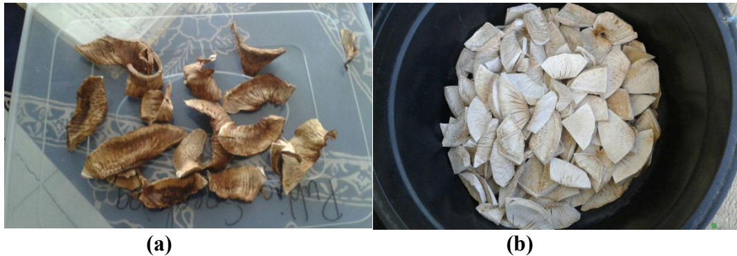
Gambar 1. Perbandingan gaplek sukun (a) dengan perebusan dan gaplek sukun (b) dengan perendaman larutan garam

Berdasarkan percobaan yang dilakukan, penghilangan getah dengan cara direbus dan dengan direndam dengan larutan garam memberikan hasil yang berbeda. Potongan sukun yang direbus terlebih dahulu akan memberikan warna coklat saat dilakukan pengeringan. Hal ini berbeda dengan potongan sukun yang direndam dengan larutan garam kemudian dicuci. Potongan sukun yang direndam dengan larutan garam akan berwarna putih dan tidak banyak ditumbuhi jamur. Bentuk gaplek sukun disajikan pada gambar 1.