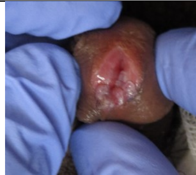
Gambar 2. Pemeriksaan acetowhite hari ke-1