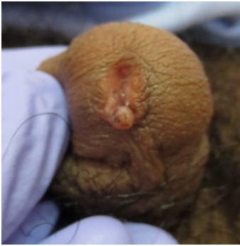
Gambar 1. Pengamatan hari ke-1