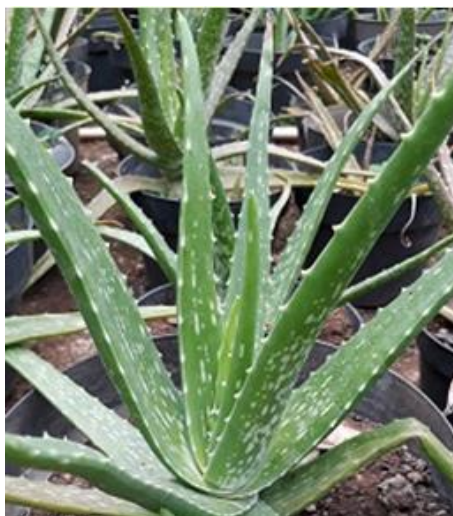
Gambar 1. Aloe vera yang dibiakkan di pot berfundis sebagai tanaman hias sekaligus sebagai bahan pangan

Aloe merupakan tanaman tahunan, sukulen, monokotil dengan tinggi rata-rata 60-100 cm (Akinyele and Odiyi 2007). Aloe milik kelompok besar tanaman dikenal sebagai xeroid karena kemampuannya untuk menutup stomata sepenuhnya untuk menghindari kehilangan air dan membantu menahan sejumlah besar air di jaringannya (Akinyele and Odiyi 2007).