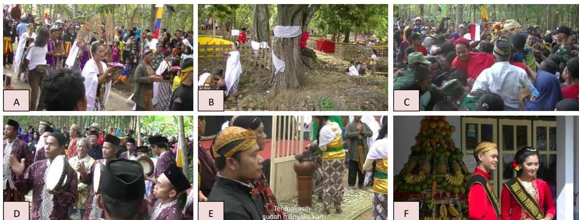
Gambar 3. Beberapa Kegiatan Kirab Reresik Sumur Pitu . (A) Peserta kirab, (B) Pengambilan air di mata air (sumur), (C) Berebut tumpeng buah (gunungan), (D) Pemain sholawatan , (E) Upacara jamasan, dan (F) Peserta kirab berfoto di depan tumpeng buah (gunungan)

Akhir kirab dilakukan acara makan tumpeng bersama. Makan tumpeng bersama ini dilakukan di halaman balai Kelurahan Cangkreng Kidul dengan dilakukan tahlil dan doa.