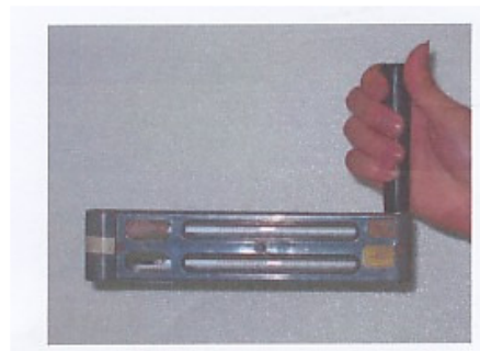
Gambar 1. Sling termometer

Lokasi yang digunakan dalam penelitian ini adalah ruang Fakultas Teknik Kampus Tarumanagara. Sementara itu alat yang digunakan adalah sling termometer (Gambar 1) untuk menghitung suhu udara kering dan suhu udara basah, anemometer untuk mengukur kecepatan udara (Gambar 2), diagram temperatur efektif, diagram psikometri (untuk mendapatkan nilai kelembaban udara) dan alat tulis.