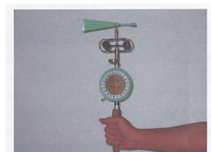
Gambar 2. Anemometer