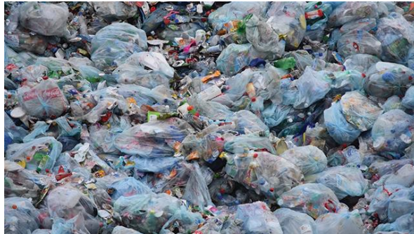
Gambar 2.2. Sampah Plastik