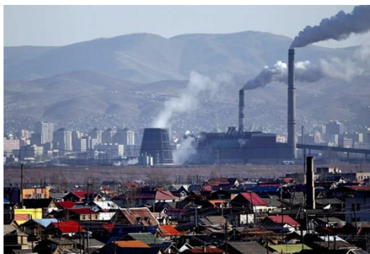
Gambar 2.1. Polusi Udara Akibat Industri

Pertumbuhan pembangunan industri, disamping memberikan dampak positif, di sisi lain juga memberikan dampak negatif, berupa pencemaran udara dan kebisingan, baik yang terjadi di dalam ruangan ( indoor ) maupun di luar ruangan ( outdoor ) yang dapat membahayakan kesehatan manusia. Industri pabrik menyebabkan banyaknya asap yang dihasilkan, dan dapat mengakibatkan polusi udara yang akan membuat lingkungan tercemar dan terjadinya pemanasan global. Zat yang keluar dari proses industri berupa zat yang berbahaya seperti Karbon Monoksida, Hidrokarbon, dan senyawa lainnya yang dapat membahayakan kesehatan alam dan manusia. Jadi pengoperasian industri berpotensi menimbulkan dampak terhadap penurunan kualitas udara dan peningkatan kebisingan.