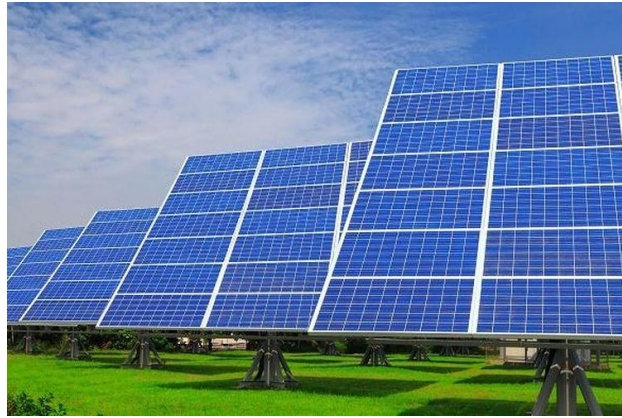
Gambar 3.2. Panel Surya