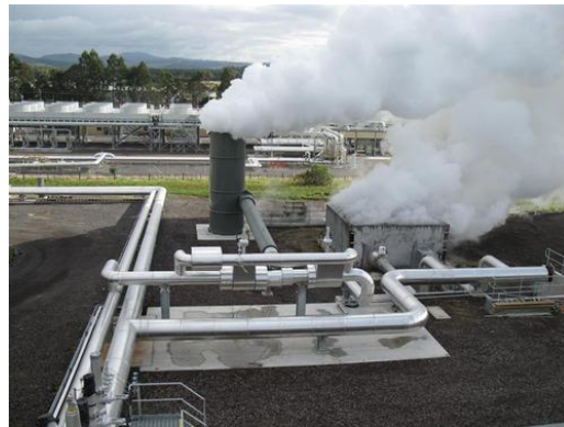
Gambar 3.4. Pembangkit Listrik Tenaga Hidrotermal Sumatra Utara

Tenaga hidrotermal adalah tenaga panas dalam bumi yang keluar melewati celah batuan seperti kawah. Panas bumi yang keluar secara alami jauh lebih efisien untuk memutar turbin generator listrik. Salah satu contoh pembangkit listrik hidrotermal di Indonesia adalah PLTU Kamojang yang berada di Kabupaten Bandung, Jawa Barat. .