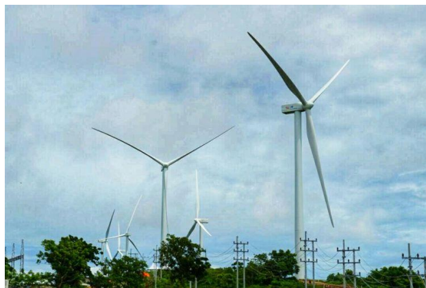
Gambar 3.3. Pembangkit Listrik Tenaga Angin Sidrap Sulawesi Selatan

Kincir angin dapat digunakan sebagai pembangkit listrik dengan menggunakan tenaga angin yang ada. Hembusan angin dapat memutar kincir yang kemudian memutar generator dan akhirnya menghasilkan listrik dalam jumlah besar. Pembangkit listrik tenaga angin merupakan sumber energi alternatif yang paling bersih karena tidak menghasilkan polusi, dan juga tidak menghasilkan emisi gas beracun beracun, tidak seperti panel surya yang bahannya bisa menjadi racun saat dibuang, karena kincir angin tidak mengandung bahaya racun sama sekali. Tenaga angin juga ramah lingkungan karena tidak merusak ekosistem ataupun keberlangsungan hidup hewan dan tumbuhan disekitarnya.