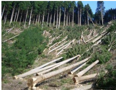
Gambar 3.1. Penebangan Hutan