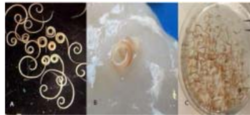
Gambar 2. Gambaran makroskopis larva Anisakis sp. Dengan sedikit perbedaan diantara masing-masing spesies. gbr A. larva A. simplex warna putih semi-transparan, gbr B. larva P. decipiens berwarna coklat kemerahan dan gbr C. larva C. osculatum berwarna abu-abu kekeklatan semi-transparan. 7 dengan modifikasi

Secara makroskopis seperti terlihat pada gambar 2. Cacing Anisakis sp memiliki karakteristik khas cacing-cacing kelompok nematoda. Meskipun di dalam genus ini terdapat beberapa spesies namun gambaran makroskopisnya sekilas mirip dan sulit dibedakan oleh orang awam.