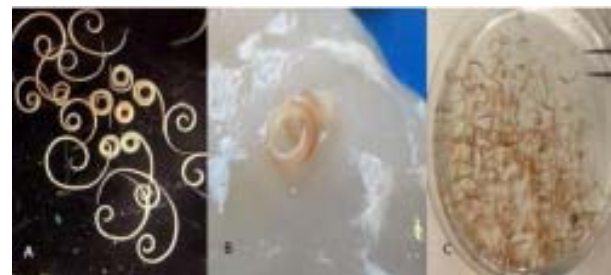
Gambar 2. Gambaran makroskopis larva Anisakis sp. Dengan sedikit perbedaan diantara masing-masing spesies. gbr A. larva A. simplex warna putih semi-transparan, gbr B. larva P. decipiens berwarna coklat kemerahan dan gbr C. larva C. osculatum berwarna abu-abu ekecoklatan semi-transparan. 7 dengan modifikasi

Secara makroskopis seperti terlihat pada gambar 2. Cacing Anisakis sp memiliki karakteristik khas cacing-cacing kelompok nematoda. Meskipun di dalam genus ini terdapat beberapa spesies namun gambaran makroskopisnya sekilas mirip dan sulit dibedakan oleh orang awam.