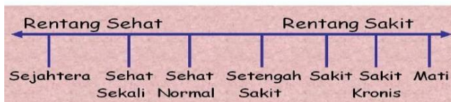
Gambar 1. Rentang Sehat Sakit menurut Model “ Holistik Health ”

Berikut ini adalah Rentang Sehat Sakit menurut Model “ Holistik Health ”: