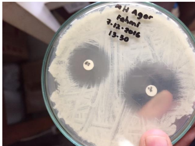
Lampiran 4. Zona Hambat Isolat Candida spp. pada Media Agar MH yang diuji dengan Anti Jamur