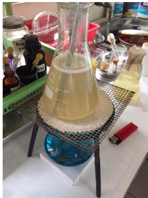
Lampiran 2. Proses Pemanasan Agar Mueller Hinton dengan Aquadest