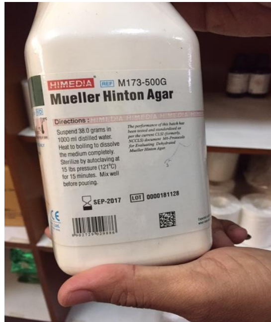
Lampiran 1. Agar Mueller Hinton