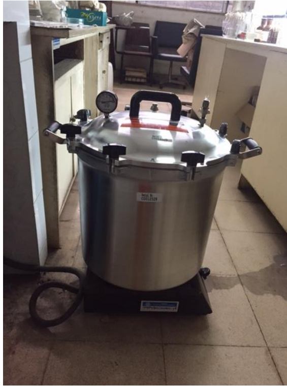
Lampiran 3. Autoklaf untuk Proses Sterilisasi Alat dan Bahan