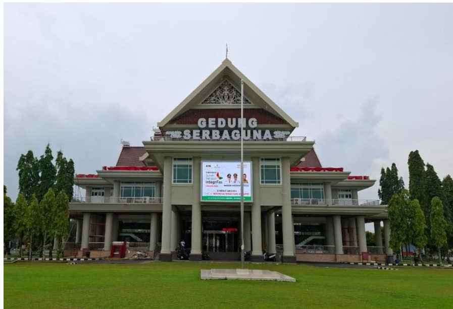
Gambar 1.2 Gedung Serbaguna (GSG) Sangatta

Urgensi untuk meninjau kembali identitas lokal dalam arsitektur publik semakin tinggi seiring meningkatnya pembangunan gedung-gedung baru. Bangunan publik tidak hanya perlu memenuhi fungsi fisik, tetapi juga harus mencerminkan nilai budaya masyarakat yang dilayaninya. Keterhubungan antara arsitektur dan identitas budaya menjadi penting agar masyarakat merasa memiliki hubungan emosional dengan ruang publik mereka. Dengan demikian, diperlukan pendekatan yang lebih sensitif terhadap budaya lokal dalam desain bangunan public. Kesenjangan penelitian muncul ketika teori arsitektur mengenai neo-vernakular menekankan pentingnya reinterpretasi budaya secara mendalam, namun praktik di lapangan menunjukkan dominasi penggunaan simbol visual tanpa pengolahan makna. Para ahli seperti Oliver, Frampton, dan Jencks menekankan bahwa identitas lokal harus diwujudkan melalui esensi budaya, bukan sekadar ornamen. Akan tetapi, temuan awal di lapangan menunjukkan bahwa simbol-simbol Dayak Kenyah pada bangunan publik lebih banyak berfungsi sebagai elemen estetis. Gap inilah yang memperlihatkan adanya ketidaksesuaian antara teori dengan realitas desain. Penelitian ini memiliki kontribusi orisinal yang membedakannya secara jelas dari penelitian-penelitian sebelumnya yang mengkaji arsitektur neo-vernakular pada bangunan publik. Kajian terdahulu pada umumnya