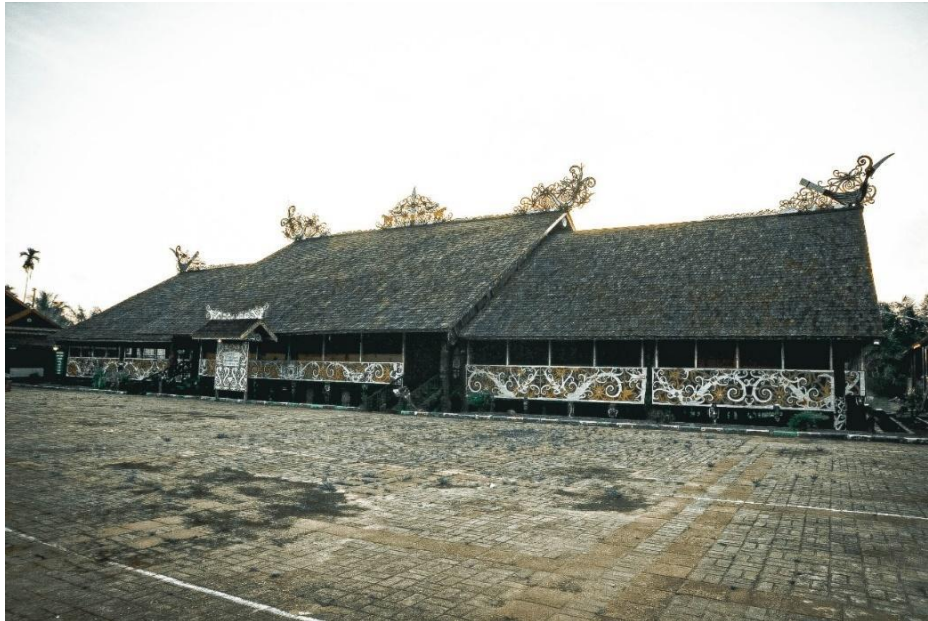
Gambar 1.1 Lamin Dayak Kenyah, Desa Pampang

daerah lainnya di Kalimantan Timur. Dengan demikian, latar sejarah dan budaya ini seharusnya dapat memberikan arah bagi pengembangan arsitektur daerah.