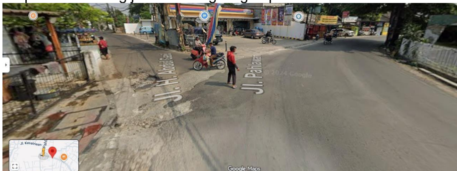
Gambar 1 . Koridor Jalan Pahlawan, Ciputat, Kota Tangerang Selatan

Secara keseluruhan, karakteristik kawasan ini menggambarkan kondisi permukiman perkotaan padat yang belum ditunjang oleh sistem penataan utilitas yang terintegrasi. Meningkatnya kebutuhan telekomunikasi tidak diimbangi dengan pengelolaan infrastruktur bawah tanah yang terencana, sehingga menjadikan Jalan Pahlawan sebagai lokasi yang signifikan untuk menilai pengaruh penataan kabel optik terhadap kualitas ruang jalan dan lingkungan permukiman.