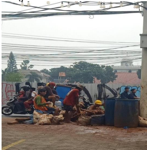
Gambar 3. Kondisi Eksisting Penggalian Utilitas Kabel Optik Bawah Tanah, Ciputat, Kota Tangerang Selatan

Wawancara dengan Dinas PUPR dan Kominfo menunjukkan bahwa koordinasi antarinstansi belum optimal. Setiap operator telekomunikasi cenderung melakukan pekerjaan secara terpisah tanpa rencana utilitas bersama ( utility ducting ). Akibatnya, koridor Jalan Pahlawan terlihat semrawut, estetika lingkungan menurun, dan kualitas ruang jalan mengalami degradasi.