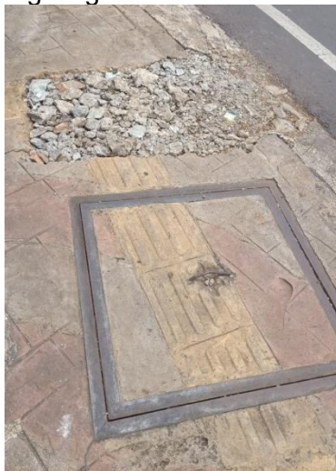
Gambar 1. Kondisi Trotoar di Jalan Pahlawan Ciputat Setelah Pemasangan Kabel Optik (Sumber: Dokumentasi Lapangan, 2025)

Selain itu, penggalian kabel optik di lokasi ini tidak konsisten dengan rencana awal. Setiap kali terjadi penambahan jaringan, kontraktor kerap menggali lubang baru di lokasi berbeda dari jalur yang sudah ada. Praktik ini menimbulkan inefisiensi, menurunkan kualitas estetika kawasan, serta memperbesar gangguan bagi pejalan kaki dan kendaraan (Melati et al., 2024). Bagi warga sekitar, galian berulang menambah beban berupa debu, kebisingan, genangan air, hingga kemacetan lalu lintas saat pekerjaan berlangsung.