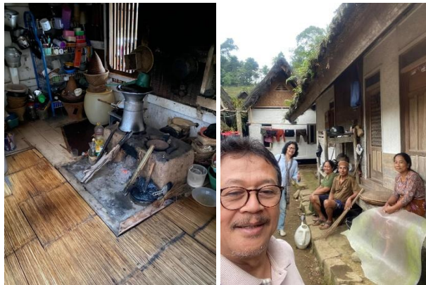
Gambar 5. Kampung Naga