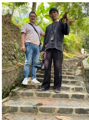
Gambar 6. Bersama tokoh masyarakat Kampung Naga