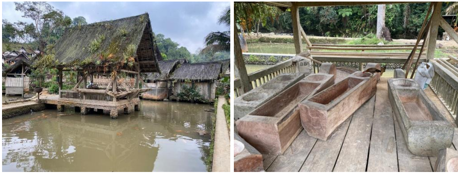
Gambar 4. Kampung Naga