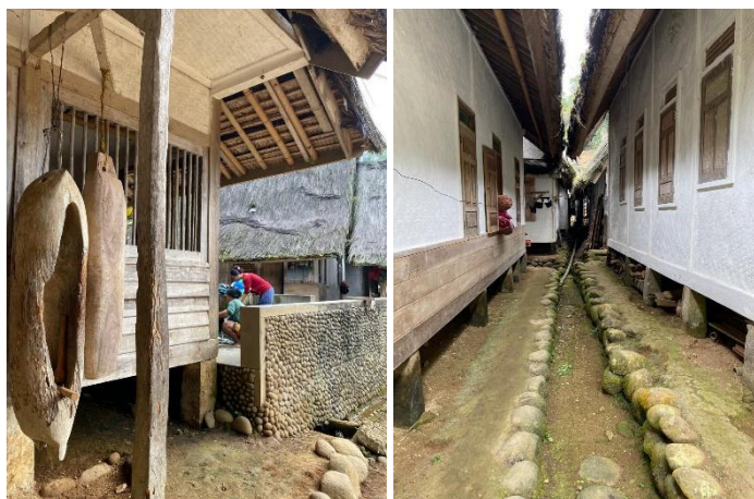
Gambar 3. Kampung Naga

Penelitian dalam kajian konsep wisata Kampung Naga menuju arsitektur berkelanjutan yaitu berupa pengumpulan data lapangan dengan terjun peninjau fisiknya, serta pengumpulan dengan wawancara kepada pihak-pihak yang terkait baik narasumber dan media sosial lainnya.