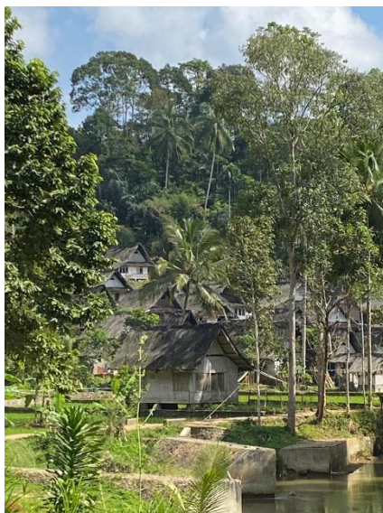
Gambar 2. Kampung Naga

Kampung Naga diperkirakan berasal dari Kerajaan Galunggung. Mengacu kepada bukti keurbakalaan. Masyarakat Kampung Naga berasal dari Kerajaan Galunggung, yang berlokasi sekitar Tasikmalaya. Dari penuturan Bapak Harun Alrazid, Kanwil Depdikbud Tasikmalaya mengatakan karena sempitnya lahan kesuburan pertanian Kerajaan Galunggung semakin berkurang, para petani mendapat tempat baru yaitu sebelah timur Kerajaan Galunggung yaitu di tepi Sungai Ciwulan. Konon inilah awal dari perubahan Kampung Naga.