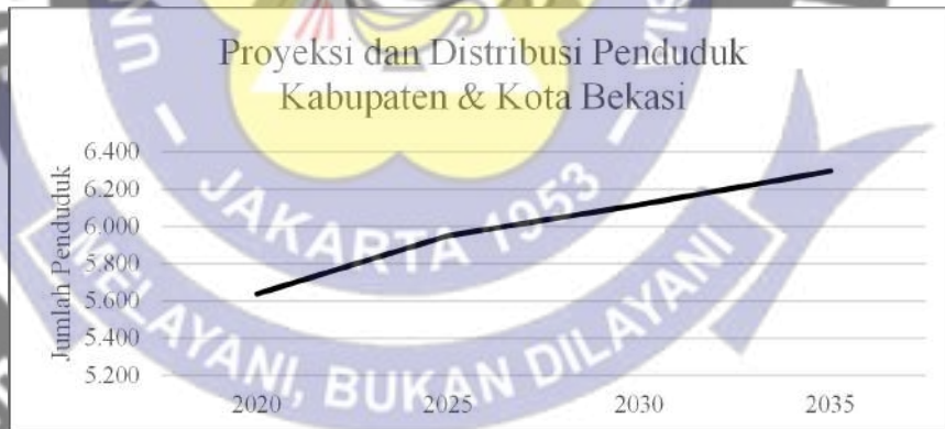
Diagram 1.1 Proyeksi dan Distribusi Penduduk

Sebagai salah satu kota penyangga utama Jakarta, Bekasi mengalami pertumbuhan pesat pada sektor permukiman dan infrastruktur. Kedekatannya dengan Ibu Kota sebagaimana tercatat dalam Statistik Komuter Jabodetabek Badan Pusat Statistik (2023), serta tersedianya akses transportasi seperti jalan tol, commuter line, dan jaringan transportasi umum lainnya menjadikan Bekasi sebagai pilihan utama masyarakat urban yang membutuhkan hunian terjangkau namun strategis. Kondisi ini mendorong percepatan pembangunan perumahan, terutama rumah tapak. Sebagaimana ditunjukkan dalam Diagram 1.1 mengenai proyeksi dan distribusi penduduk, Bekasi tercatat sebagai salah satu wilayah dengan jumlah penduduk terbesar di Provinsi Jawa Barat, yang berimplikasi pada masifnya pengembangan kawasan hunian baru.