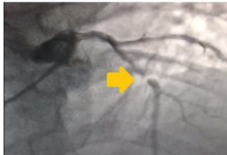
Gambar 2. Gambaran ekokardiografi saat dilakukan intervensi koroner perkutaneus. Terlihat sumbatan pada arteri descendens anterior kiri sebesar 90%