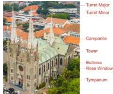
Gambar 1 Identifikasi visual langgam neo-gotik.

Gambar 1. Wujud eksterior langgam neo-gotik juga mengandung ornamen-ornamen organik yang tersebar secara berpola pada setiap unsur, seperti misalnya pada bagian turret di mana rangkaian rangka ruang tiga dimensional yang terjalin dari batang-batang baja tidak hadir mulus begitu saja melainkan terdapat tonjolan-tonjolan aksentuasi dengan pola-pola peletakan tertentu. Jika diperhatikan tonjolan-tonjolan aksentuasi tersebut menyerupai pola dari ragam hias gargoyle , wujud makhluk mitos yang biasa terdapat pada gereja-gereja berlanggam gotik.