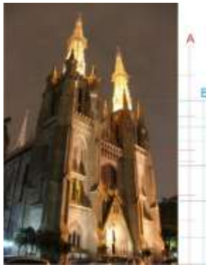
Gambar 4 Transformasi bentuk pada menara.

tubuh utama menara diakhiri dengan turret major (garis diagram A). Sementara bagian minor menara diakhiri dengan turret minor di bagian atas yang didahului dengan menara kecil (garis diagram B). Transformasi bentuk yang mengalir secara vertikal ini merupakan ciri yang kuat dalam rancangan berlanggam gotik dan neo-gotik (Shelby, 1977, pp. 82-111), (Bork, 2016, pp. 35, 41).