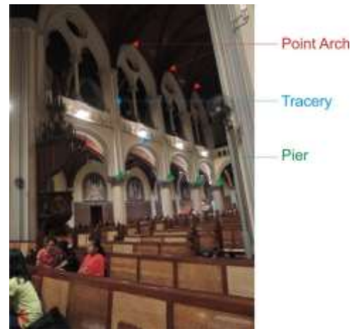
Gambar 6 Pointed arch pada setiap datum clerestory.

akhir bagian atas setiap dinding clerestory di dalam satu segmen datum. Pelengkung runcing ini menyambung dengan plafond lambersering berbentuk kubah tersegmentasi yang terbagi dalam empat bidang ( quadrapartite ) di mana masing-masing bidangnya merupakan bidang lengkung. Sisi-sisi antar bidang plafond yang melengkung ini dihubungkan dengan bingkai rusuk ( rib vault ).