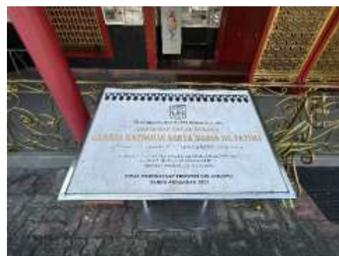
Gambar 14 Prasasti Cagar Budaya

Bersejarah di DKI Jakarta yang dilindungi. Keberadaan bangunan ini mengukuhkan adanya pemukiman khusus untuk etnis Orang Cina yang menjadi mitra Belanda pada masa kolonial atau masa pemerintahan Hindia Belanda di Batavia. Namun baru pada tanggal 29 Maret 1993 dikeluarkan Surat Keputusan Gubernur DKI Jakarta nomor 475 tahun 1993 (Heuken SJ, 2007). Surat Keputusan Gubernur DKI Jakarta ini dibuat prasasti yang dipasang di selasar depan gereja, yang nampak pada Gambar 14. Surat Keputusan Gubernur DKI diperkuat dengan SK Menteri No: PM.13/PW.007/MKP/05 ditetapkan 25 April 2005 (PDA, 2016).