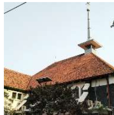
Gambar 12 Tampak luar Gereja Katolik St. Antonius Padua, Bidaracina.