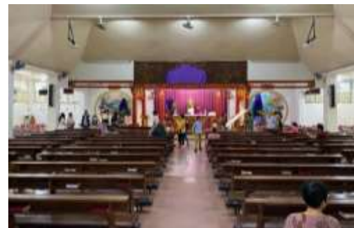
Gambar 16 Interior.

Pada bagian interior gereja nampak terjadi perbedaan suasana pada panti umat dengan zona panti imam dan selasar di kiri dan kanan, seperti pada Gambar 16. Perbedaan ini diduga terjadi karena pengembangan bangunan sisipan ( in-fill development ) pada zona yang tadinya merupakan halaman dalam dari tapak rumah.