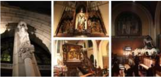
Gambar 8 Pelbagai seni sakral yang menjadi elemen interior gereja.

Kemudian ciri khas neo-gotik yang khas gereja Katolik yang terdapat pada gereja katedral ini adalah dengan hadirnya pelbagai seni sakral yang berguna memperkuat iman umat dengan menghadirkan memorabilia kisah-kisah pelbagai tokoh yang diakui Gereja dapat memberi teladan yang baik atau gambaran kisah jalan salib seperti pada rangkaian Gambar 8. Pada gereja katedral, tokoh-tokoh diwujudkan dalam rupa patung dan kisah jalan salib diwujudkan dalam lukisan fresco di dinding arkade ruangan umat.