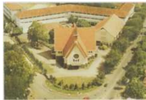
Gambar 10 Gereja St. Theresia, pastoran dan gedung paroki sekitar tahun 1970-an.

Gambar 11. Setelah Konsili Vatikan II tahun 1962, gereja ini mengalami penyesuaian, yakni posisi altar tidak lagi menempel dinding namun bergeser ke bagian tengah panti imam. Posisi tabernakel dan hiasannya juga bergeser ke samping kanan di area panti imam. Peneliti tidak menemukan catatan tentang pelaksanaan penyesuaian panti imam tersebut.