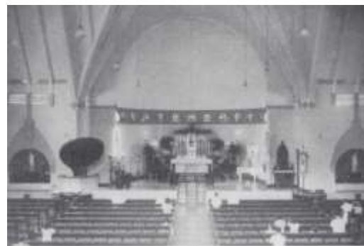
Gambar 11 Interior gereja sebelum perubahan, yang dianjurkan oleh Konsili Vatikan.