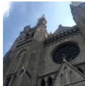
Gambar 2 Rose window dan menara bagian depan.

Gubahan massa bangunan yang hirarkial sekaligus terintegrasi dan koheren juga dapat dirasakan pada pandangan sisi bangunan, seperti nampak pada