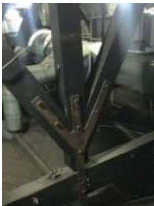
Gambar 9 Huruf-huruf china pada besi kuda-kuda, menandakan bahwa pelaksanaan konstruksi oleh pekerja etnis Tionghoa.

Sistem struktur dan bahan bangunan yang terdapat pada gereja katedral ini juga menjadi signifikansi di mana ditemukan sistem sambungan ( join ) antar unsur struktur sudah tidak ditemukan lagi pada metode konstruksi masa kini. Demikian juga dengan volume gelagar kayu yang mungkin sulit ditemukan pada saat ini. Pada zaman gereja katedral dibangun, nampak ada kecenderungan bahwa pihak yang mengerjakan pekerjaan konstruksi kayu membuat tanda pengenal pada hasil karyanya seperti nampak pada Gambar 9.