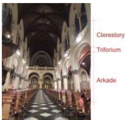
Gambar 5 Datum arkade pada ruangan umat.

Gambar 5. Bidang pemisah semu ini dibagi dalam datum-datum yang seragam. Setiap datum terdiri dari tiga lapis unsur, yaitu arkade (selasar), triforium dan clerestory . Pada katedral Jakarta, pada bagian clerestory terdapat selasar yang dapat dilalui dan berlantai kayu.