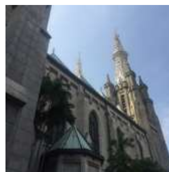
Gambar 3 Tampak samping kanan.

Jika diperhatikan lebih jauh, langgam neo-gotik pada bagian eksterior dapat diidentifikasi dari transformasi bentuk secara vertikal pada menara seperti nampak pada