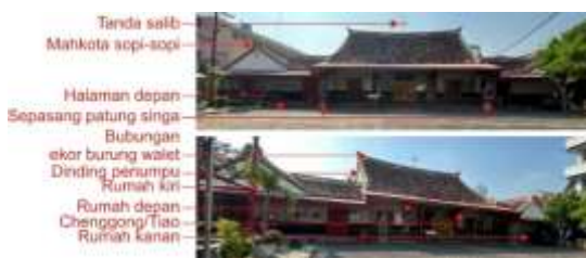
Gambar 15 Tampak Depan

Dalam hal signifikansi arsitektur, langgam yang dimiliki oleh gereja Katolik Santa Maria de Fatima ini adalah langgam Tionghoa peranakan. Dalam hal tapak bangunan, jika menggunakan identifikasi Pratiwo, gereja ini memiliki tapak yang mirip dengan tapak kelenteng meski memiliki fungsi sebagai rumah tinggal (Pratiwo, 2010, pp. 187-188). Sementara tapak depan gereja, pada Gambar 15, menunjukkan ciri visual langgam Tionghoa peranakan. Ciri adaptive-used (penggunaan dengan adaptasi fungsi) nampak pada simbol salib yang ada di bubungan atap sebagai penanda fungsi bangunan sekarang adalah sebagai tempat ibadah umat Kristiani.