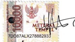
Yosafat Sahala Tua Hutasoit