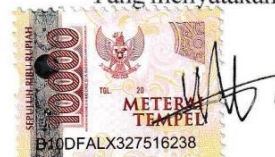
Yosafat Sahala Tua Hutasoit