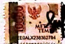
Helveria Santa Yohana

Dibuat di Jakarta Pada Tanggal 6 Agustus 2024 Yang Menyatakan