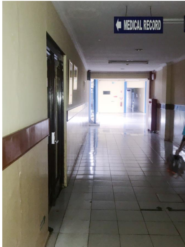
Foto Letak Ruang Rekam Medis