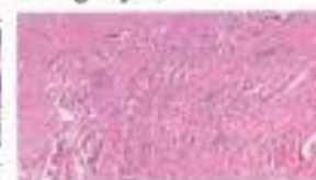
Figure 1. Categories of foreign body reactions to injected silicone. Category 1: No visible reaction. Category 2: Mild reaction with a few inflammatory cells. Category 3: Inflammatory cells and one or two giant cells. Category 4: Inflammatory cells and more than 2 giant cells. Less than 50% of the area is fibrotic. Category 5: Inflammatory cells and more than 2 giant cells. Less than 50% of the area is fibrotic. Category 6: Inflammatory cells and one giant cell. Less than 50% of the area is fibrotic. Category 7: Less than 50% of the area is fibrotic. No giant cells. Category 8: Less than 50% of the area is fibrotic. No giant cells.