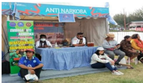
Gambar 4. Posko yang dibangun oleh Lembaga Anti Narkoba (LAN) dan Spanduk Anti Narkoba.

Hasil Penyuluhan Melalui Model Promotif. Setelah penyuluhan hukum desa wisata internasional bebas narkoba dilaksanakan, peserta penyuluhan pihak Dinas Kebudayaan dan Pariwisata Kabupaten Toba dan Lembaga Anti Narkoba (LAN) melakukan kampanye anti narkoba dengan mendirikan pokso tempat pengaduan penyalahgunaan narkoba. Selama kampanye anti narkoba Januari-Februari 2023, sekitar 10.000 warga Kabupaten Toba menandatangani spanduk yang berisi ikrar anti narkoba Posko Anti Narkoba, Kegiatan Pengumpulan tandatangan dan Ikrar dengan 10.000 tandatangan ada panda Gambar 4, 5 dan 6.