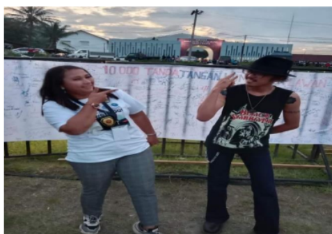
Gambar 6. Spanduk berisi 10.000 Tandatangan Ikrar Anti Narkoba.

Pada gambar 4, spanduk pada Posko Anti Narkoba berisi narasi “bebaskan diri dari narkoba” merupakan seruan kepada warga masyarakat Kabupaten Toba dan pengunjung sebelum Ajang Balap Power Boat F1 H2O World Championship di Balige. Seruan ini dilakukan dengan mengambil tandatangan warga yang berjanji anti narkoba (gambar 5), dan Ikrar masyarakat Toba dengan megumpulkan 10.000 tandatangan merupakan wujud seruan anti narkoba sebagaimana pada gambar 6. 11