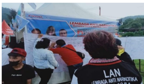
Gambar 5. Lembaga Anti Narkoba (LAN) Kampanye Anti Narkoba dengan Mengumpulkan Tandatangan Mendukung Anti Narkoba