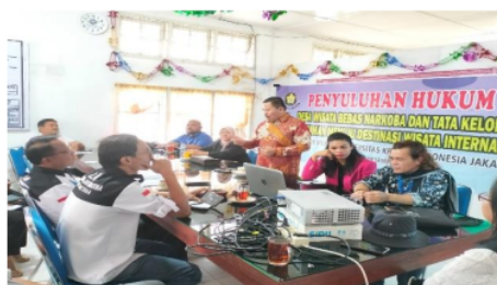
Gambar 3. Sesi tanya-jawab antara pemateri dengan peserta penyuluhan

Selama pelaksanaan kegiatan, khususnya pada sesi tanya jawab, antusiasme peserta untuk mengetahui metode pemberantasan penggunaan narkotika sangat tinggi. Pada gambar 2, pemateri menjelaskan teknik pemberantasan narkotika dengan metode promotif. Peserta disarankan untuk membuat brosur dan famplet berisi larangan menggunakan narkotika, akibatnya kepada individu, masyarakat dan pariwisata. Dinas Kebudayaan dan Pariwisata Toba diminta untuk mengedarkan poster dan famplet berisi larangan penggunaan narkotika khususnya ke lokasi wisata, café dan restoran yang menjadi rumah peredaran narkotika. Toba.