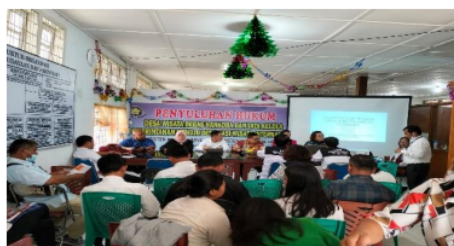
Gambar 2. Pemaparan materi Desa Wisata Internasional bebas narkotika oleh pemateri

Metode pelaksanaan bisa dilihat pada gambar 2 dan 3.