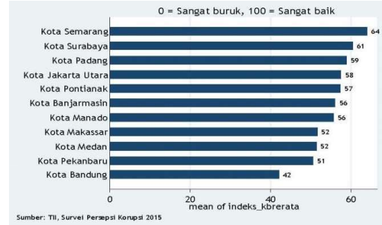
Gambar 3. Persepsi Pengusaha tentang Kemudahan Berusaha [3]

Pengusaha diminta untuk menilai seberapa kuat unsur daya saing dengan kriteria 0 jika sangat buruk dan 100 jika sangat baik. Diantara daerah yang disurvei, secara relative, Kota Semarang dan Kota Surabaya menduduki peringkat teratas kota dengan persepsi kemudahan berusaha. Sementara Kota Pekanbaru dan Kota Bandung menduduki peringkat terbawah kota dengan persepsi kemudahan berusaha terendah. Peringkat ini didasari atas akumulasi skor masing-masing unsur kemudahan berusaha di masing-masing kota. Lihat gambar di bawah ini.