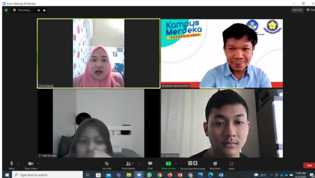
Gambar 3. DPL dan Mahasiswa Berkoordinasi untuk Membahas Program-Program Kerja