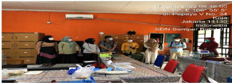
Gambar 2. DPL dan para Mahasiswa Berkoordinasi dengan Pihak Sekolah Sasaran