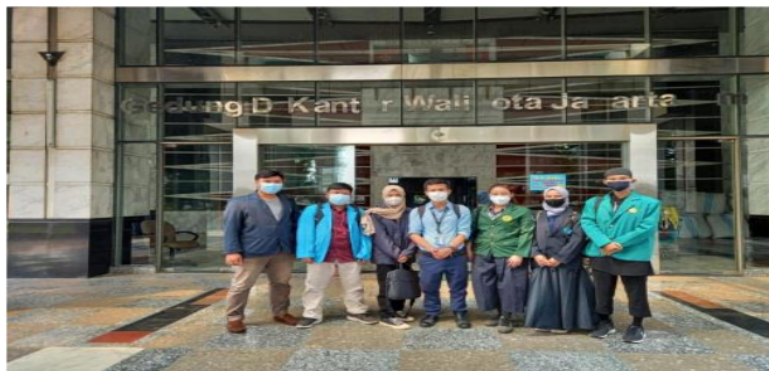
Gambar 1. Berkoordinasi Dengan Suku Dinas Pendidikan di Wilayah Sekolah Sasaran Kampus Mengajar

Dosen Pembimbing Lapangan bersama para Mahasiswa mengunjungi kantor Suku Dinas Pendidikan Wilayah setempat untuk menyerahkan dokumen (surat tugas dari kemendikbudristekdikti dan surat tugas dari kampus masing-masing mahasiswa, serta identitas diri DPL dan mahasiswa). Dosen dan para mahasiswa selanjutnya akan mendapatkan surat tugas dari kepala suku dinas untuk dibawa ke sekolah sasaran.