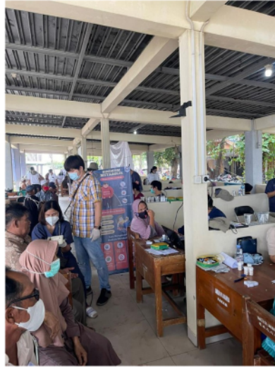
Gambar 3. Wawancara dengan kuisisioner dan pemeriksaan kesehatan