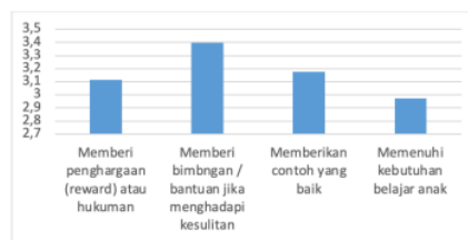
Gambar 2. Grafik Sebaran Perhatian Orang Tua

8 hkan dalam lingkungan masyarakat. Hasil penelitian ini memperlihatkan bahwa terdapat korelasi antara perhatian orang tua dengan prokrastinasi siswa. Dengan demikian hipotesis kedua diterima. Penelitian ini mendukung penelitian (Rosita, 2021) yang menyatakan bahwa dukungan perhatian dari orang tua berkaitan dengan prokrastinasi akademik atau menunda-nunda pekerjaan.