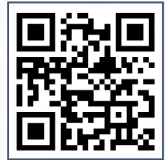
QR Barcode e-Certificate

VIRTUAL SEMINAR | 7 Oktober 2020 M | 19 Safar 1442 H