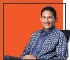
Sandiaga S. Uno, MBA)* (Pengusaha Nasional)