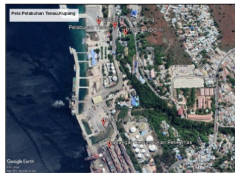
Gambar 1 Lokasi Pelabuhan Tenau Kupang

Lapangan penumpukan atau terminal petikemas merupakan tempat sementara untuk meletakkan petikemas. Berdasarkan pengamatan langsung di Pelabuhan Tenau Kupang, petikemas kosong masih diletakkan di lapangan penumpukan yang sama, padahal luas lapangan penumpukan hampir penuh (gambar 1).