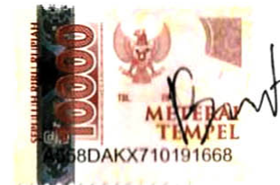
Bimo Aji Pramono

Dibuat di Jakarta Pada 20 September 2023 Yang Menyatakan,