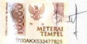
Dewi Sartika Sitanggang