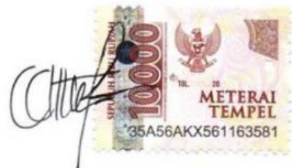
Sintikhe Glencia Dwigita