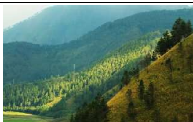
Gambar 1b. Pemandangan Gunung Pusuk Buhit

Pusuk Buhit juga menjadi salah satu tempat suci bagi suku Batak Toba. Menurut kepercayaan mereka, gunung ini merupakan tempat turunnya Raja Batak oleh sang pencipta, yang disebut Mulajadi Nabolon. Oleh karena itu, banyak warga yang datang ke sana untuk mencari kesembuhan, berdoa, dan melakukan kegiatan religi lainnya. Saat mendaki, kita juga harus menghormati adat dan budaya setempat, seperti mengucapkan "permisi Opung" ketika bertemu dengan bebatuan yang besar.