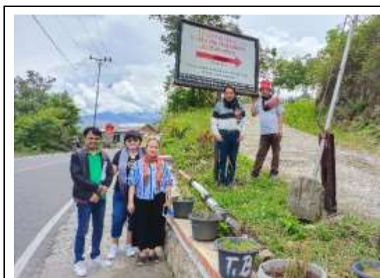
Gambar 1a. Menuju Gunung Pusuk Buhit

Gunung Pusuk Buhit bisa dijelajahi oleh siapa saja, baik pegiat alam maupun para traveler dari berbagai tempat yang ingin mendaki dan menikmati keindahan puncaknya. Dari puncak Pusuk Buhit, kita bisa menyaksikan panorama yang sangat menakjubkan, seperti rangkaian pegunungan yang indah yang melintasi Danau Toba yang luas. Ketika pagi datang, matahari mulai muncul dan menyapu sisa kabut yang menyelimuti puncak. Panorama yang unik ini menyatu menjadi satu dan sangat memukau bagi para pelancong.