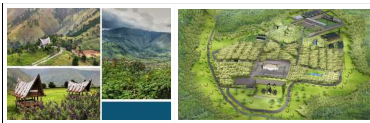
Gambar 1. Perencanaan Pengembangan Desa Adat Sigulatti

Di kawasan Pusuk Buhit, selain keindahan alamnya, terdapat banyak versi cerita turi-turian (legenda/mitos) masyarakat Batak. “Pusuk Buhit dikenal sebagai tempat asal mula orang Batak. Konon menurut cerita legenda masyarakat Pusuk Buhit, orang Batak merupakan keturunan manusia setengah dewa, yaitu Siraja Odap-odap dan Siboru Parujar yang menurunkan pasangan pertama manusia Batak di Pusuk Buhit, Raja Ihat Manisia dan Boru Ihat Manisia. Legenda ini menjadi bagian dari identitas budaya masyarakat Pusuk Buhit yang perlu dilestarikan sebagai kearifan lokal. Konon Raja Ihat dan Boru Ihat Manisia inilah yang menjadi leluhur SiRaja Batak membangun sebuah perkampungan pertama Batak di antara Lembah Sagala dan Lembah Lintong Maulana. Kampung itu dikenal dengan nama Sigulatti . Tidak lama kemudian beliau membuka kampung baru lagi yang diberi nama Sianjur Mula-Mula.” (Farid, Nurmatias, Sibarani, et al., 2021)