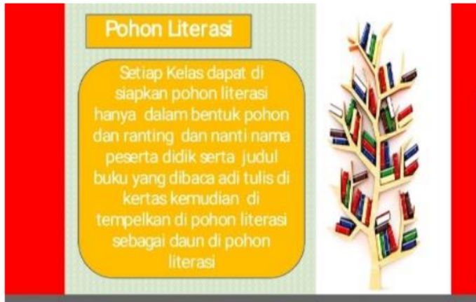
Gambar 5. Pohon Literasi

Pada Gambar 3.3 terekam acara diskusi yang diikuti secara aktif dan antusias oleh para guru dan didominasi pertanyaan tentang bagaimana cara memotivasi para peserta didik yang susah merespon intruksi yang diberikan oleh guru. Pada saat pelatihan berlangsung terdapat acara diskusi dan tanya jawab untuk mempertegas materi pelatihan. Adapun beberapa pertanyaan dari para guru mengenai kondisi siswa yang susah untuk merespon dan dimotivasi. Narasumber memperjelas apa yang menyebabkan peserta didik sulit untuk merespon dan dimotivasi, itu bisa terjadi karena kurang paham dengan instruksi yang diberikan oleh guru, faktor lain adalah kurang memahami tentang buku apa saja yang akan dibaca. Dalam hal ini peran guru sebagai fasilitator tentang materi yang layak dibaca sangat diperlukan. Guru dapat memberikan link artikel yang layak dibaca oleh peserta didik melalui internet, seperti artikel yang berkaitan dari Google Scholar .