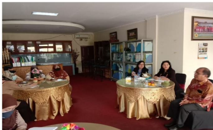
Gambar 7. Sesi diskusi guru dan narasumber

Guru-guru dan narasumber berdiskusi dengan serius didampingi oleh Ibu Kepala Sekolah SMK Paskita Global Jakarta Timur. Hasil kegiatan ABDIMAS yang dilakukan oleh tim dalam pelaksanaannya yaitu PKM tentang Peran Guru dalam Mengembangkan Literasi Peserta didik di SMK Paskita Global Jakarta. Pelaksanaan kegiatan Abdimas ini berlangsung selama 2 hari. Adapun kegiatan yang dilakukan adalah sebagai berikut: