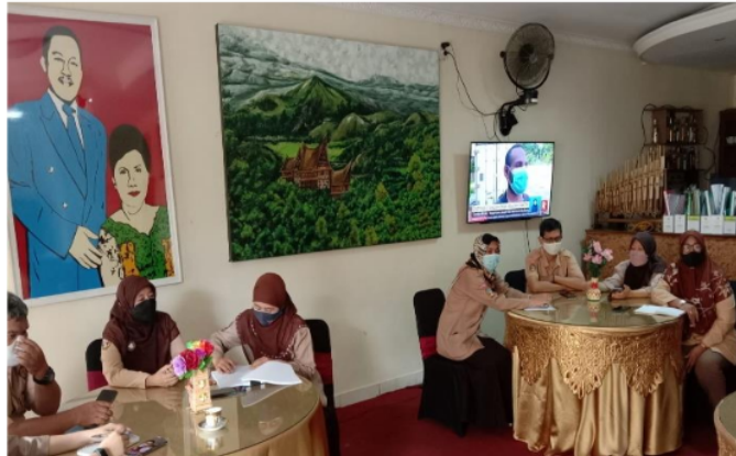
Gambar 6. Sesi pemaparan arahan dari narasumber