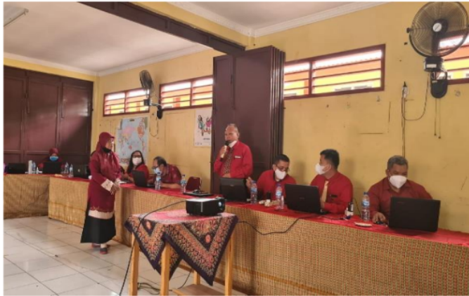
Gambar 4. Sesi diskusi dan tanya jawab

Pada Gambar 3.3 terekam acara diskusi yang diikuti secara aktif dan antusias oleh para guru dan didominasi pertanyaan tentang bagaimana cara memotivasi para peserta didik yang susah merespon intruksi yang diberikan oleh guru. Pada saat pelatihan berlangsung terdapat acara diskusi dan tanya jawab untuk mempertegas materi pelatihan. Adapun beberapa pertanyaan dari para guru mengenai kondisi siswa yang susah untuk merespon dan dimotivasi. Narasumber memperjelas apa yang menyebabkan peserta didik sulit untuk merespon dan dimotivasi, itu bisa terjadi karena kurang paham dengan instruksi yang diberikan oleh guru, faktor lain adalah kurang memahami tentang buku apa saja yang akan dibaca. Dalam hal ini peran guru sebagai fasilitator tentang materi yang layak dibaca sangat diperlukan. Guru dapat memberikan link artikel yang layak dibaca oleh peserta didik melalui internet, seperti artikel yang berkaitan dari Google Scholar .