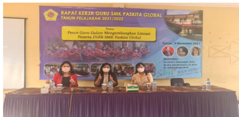
Gambar 1. Kepala Sekolah, Narasumber dan Guru-Guru SMK Paskita Global Jakarta Timur

Pelaksanaan pengembangan literasi tersebut dapat terlaksana dengan lancar ketika guru telah mengikuti berbagai pelatihan maupun kegiatan workshop dari beberapa tenaga profesional. Dibawah ini ada dua tenaga Profesional dalam bidang manajemen Pendidikan yang akan melatih para guru-guru di SMK Paskita Global Jakarta.