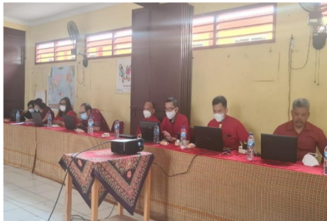
Gambar 2. Guru-Guru SMK Paskita Global Mengikuti Pelatihan dengan Antusias dan Aktif Menggunakan Laptop masing-masing

pada seseorang dalam hal ini guru-guru dan peserta didik. Menjelaskan kepada guru-guru pengaruh literasi terhadap diri seseorang yaitu untuk meningkatkan wawasan, perubahan perilaku dari tidak memahami menjadi memahami, dari kurang terampil menjadi terampil Melalui pelatihan yang diberikan oleh tim ABDIMAS, tentang mengembangkan literasi, menjadikan guru-guru bersemangat dan memahami cara berpikir aktif, kreatif dalam mengembangkan literasi.