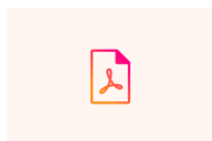
acceptance l...pdf 354.4kB

Biaya Majalah kesehatan biaya submit sebesar Rp. 250.000.- (yang dibayarkan pada saat submit) dan biaya publikasi sebesar Rp. 250.000.- (yang dibayarkan setelah proses review).