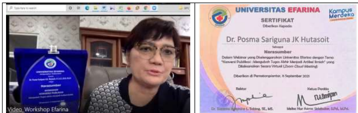
Gambar 5. Pemberian Plakat dan Sertifikat oleh Rektor Universitas Efarina