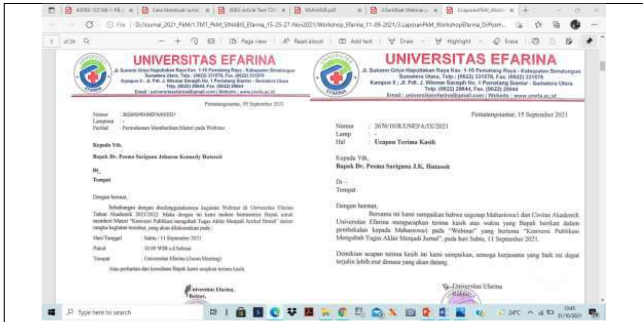
Gambar 1. Surat Undangan dan Ucapan Terima Kasih dari Mitra

Berdasarkan paparan di atas, penulis diundang untuk oleh mitra dari Universitas Efarina Pematang Siantar Sumatera Utara, sebagai narasumber untuk memberikan pelatihan atau workshop mengenai pembuatan jurnal yang baik dan benar dari skripsi yang telah mahasiswa susun. Target luaran yang diinginkan adalah mahasiswa memahami dan tidak mengalami kesulitan, serta memiliki keberanian membuat sebuah jurnal ilmiah berdasarkan hasil penelitian berupa skripsi mereka sendiri. Paparan kegiatan dan materi dilaporkan pada tulisan di paper pengabdian kepada masyarakat ini.