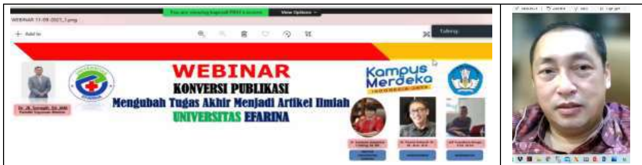
Gambar 3. Pelaksanaan Kegiatan Pelatihan oleh Nara Sumber

Metode kegiatan merupakan bagian dari strategi penguatan inovasi di bidang pendidikan dan sumber daya manusia. Topik pelatihan yang disampaikan adalah mengenai mengubah penelitian skripsi menjadi sebuah jurnal ilmiah yang baik dan benar dengan kegiatan “Webinar Konversi Publikasi Mengubah Tugas Akhir menjadi Artikel Ilmiah Universitas Efarina.”