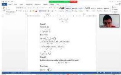
Gambar 7. Peserta Didik diajar materi turunan berbantuan modul

Pada tahap akhir, peserta didik diberikan soal test untuk mengukur hasil belajar setelah diberikan materi kepada kedua kelas. Peserta didik yang menggunakan modul turunan mendapat hasil belajar dengan rata-rata 87,20 dan peserta didik yang tidak menggunakan modul mendapat nilai rata-rata 65,51. Dengan melihat rata-rata nilai kedua kelas, maka yang menggunakan modul turunan jauh lebih baik dibandingkan peserta didik yang menggunakan buku paket sebagai sumber belajar matematika materi turunan. Perbedaan kedua rata-rata kelas menunjukkan bahwa kelas menggunakan modul turunan lulus semua dan melebihi KKM yang sudah ditetapkan. Peserta didik yang menggunakan modul diminta untuk memberikan penilaian terhadap komponen modul, kegrafikan, penyajian, desain bahasa penulisan dan nilai rata-rata komponen penilaian 95,90 serta masuk dalam kategori modul turunan yang sangat baik.