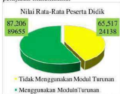
Gambar 6. Diagram Hasil Belajar

Tabel 7 bahwa materi turunan yang diajarkan dengan bantuan modul dapat meningkatkan hasil belajar yang sangat signifikan dan berada di atas kriteria ketuntasan minimal (KKM) dengan nilai rata-rata 87,20. Hal ini bernilai positif bagi peningkatan kualitas pendidikan, terutama untuk pelajaran matematika.