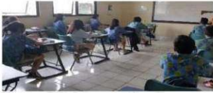
Gambar 8. Pelaksanaan Post-Test

Dari hasil tes yang diperoleh peserta didik terlihat perbandingan, kelas yang tidak menggunakan modul mendapat nilai rata-rata 65, 51 sedangkan nilai peserta didik yang menggunakan modul turunan rata-rata 87, 20 dan hal ini nilai rata-rata mengalami selisih 21, 69.