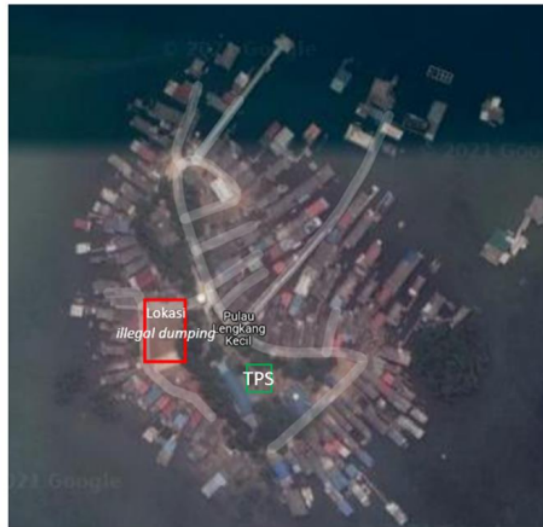
Gambar 3. Lokasi Pengumpulan Sampah di Pulau Lengkang (Google Map, 2021)

Jumlah sampah laut di Pulau Lengkang berdasarkan tiga stasiun pengamatan dapat mencapai total 19,5 \pm 3,7 \text{ kg/m}^2 . Sampah laut tersebut Sebagian besar terdiri dari sampah plastik (64%), dan diikuti dengan kertas/kardus (16,9%) beserta sampah kayu sebesar 15,3% dan karet sebesar 3,8%. Sampah plastik di lautan terdiri dari campuran banyak partikel dan benda, ukuran, kepadatan, dan bentuknya dapat diwakili oleh distribusi ukuran (Kooi & Koelmans, 2019). Karakteristik partikel plastik ini berubah terus menerus dari waktu ke waktu karena beberapa proses seperti embrittlement, fragmentasi, biofouling , pelapukan dan erosi (van Sebille et al., 2020) (ter Halle et al., 2016). Beberapa proses tersebut tidak hanya bersifat fisik atau kimia, tetapi juga dimediasi oleh aktivitas biologis (Dawson et al., 2018; Zettler et al., 2013). Daya tahan plastik terbukti sangat berbahaya, terutama plastik yang dibuang secara tidak benar dan masuk ke ekosistem. Dilaporkan bahwa 2 hingga 5% dari 249 juta ton sampah plastik yang dihasilkan pada tahun 2010 adalah sampah plastik yang tidak dikelola dengan baik (Jambeck et al., 2015) dan sekitar 6–10% plastik yang diproduksi kemungkinan akan berakhir di ekosistem laut (Troost et al., 2018).