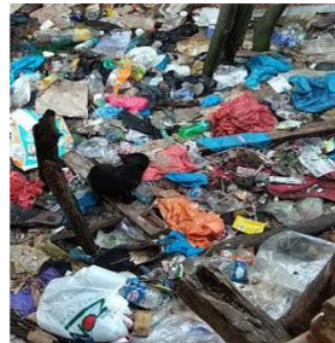
Gambar 4. Komposisi Sampah Laut di Pulau Lengkang