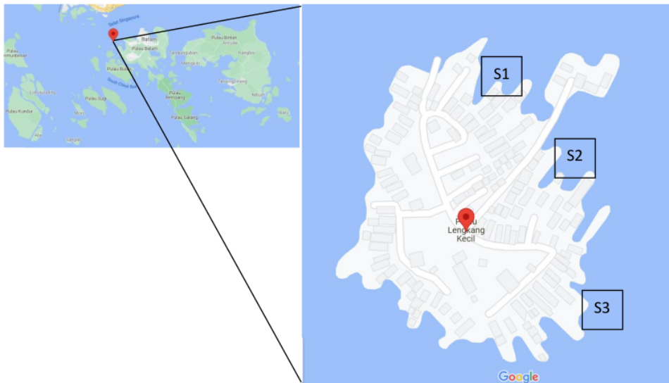
Gambar 1. Peta Pulau Lengkang beserta Stasiun Pengambilan Sampel Komposisi Sampah Laut

Setelah data kuantitatif seperti jumlah dan komposisi sampah terkumpul maka dilakukan analisa secara kaulitatif dengan deskriptif. Analisa deskriptif dilakukan dengan melakukan kajian literatur dari jurnal, prosiding, buku, maupun laporan pemerintah terkait dalam meningkatkan pengelolaan sampah di Pulau Lengkang. Ketika data sekunder tersebut didapatkan dan dibandingkan dengan observasi lapangan dari suatu masalah harus didefinisikan, teknik deskriptif dapat bermanfaat untuk mengevaluasi masalah yang terjadi di Pulau Lengkang.